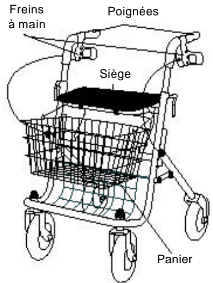
Figure 3 : Déambulateur à quatre roues

⚠ AVERTISSEMENT Certains déambulateurs sont munis d'une courroie arrière flexible. Ne tirez pas cette courroie vers le bas et ne vous appuyez pas dessus avec vos mains. N'utilisez pas la courroie pour soulever et porter le déambulateur.