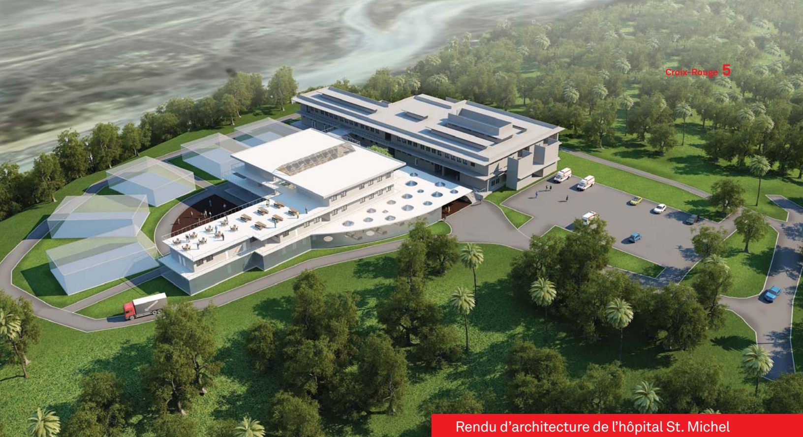
Rendu d'architecture de l'hôpital St. Michel