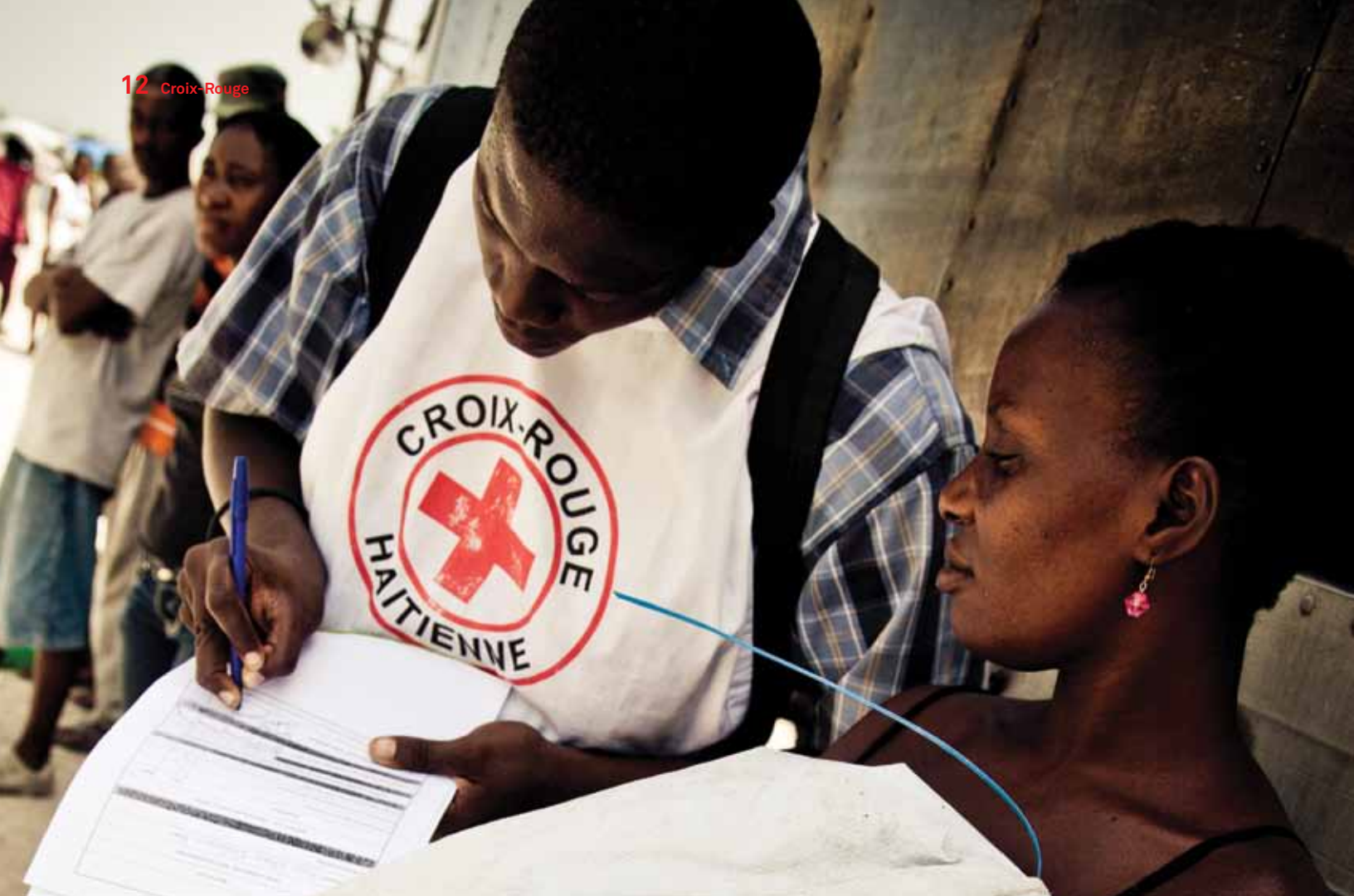
UN BÉNÉVOLE DE LA CROIX-ROUGE HAÏTIENNE DISTRIBUE UNE BÂCHE À UNE BÉNÉFICIAIRE DE LA CROIX-ROUGE